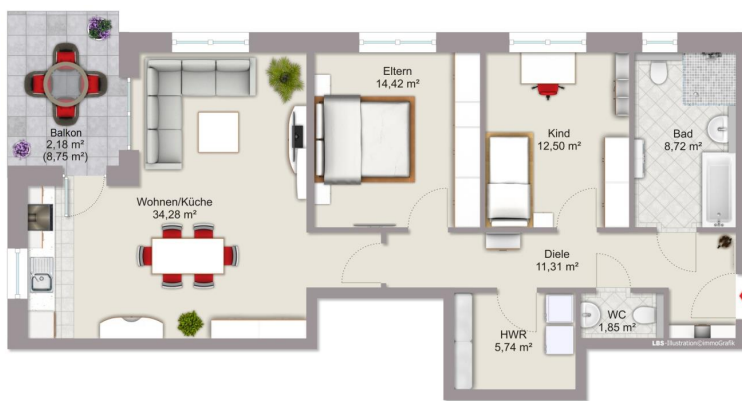
Obergeschoss WE 07