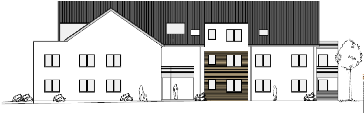
seitliche Ansicht Wiesenstraße / Rückansicht Lohfeldstraße