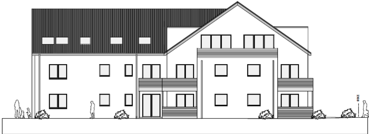
seitliche Ansicht von der Lohfeldstraße aus